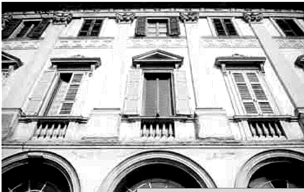
LA PRESENTAZIONE L'istituto di via Zezio ospiterà il campus

[ ■ ] La villa verrà ristrutturata integralmente compresa la parte esclusa dai contributi del ministero